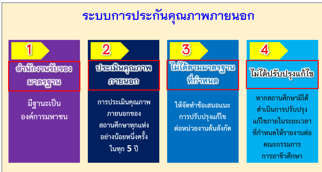
ภาพที่ 2 แสดงระบบการประกันคุณภาพภายนอก